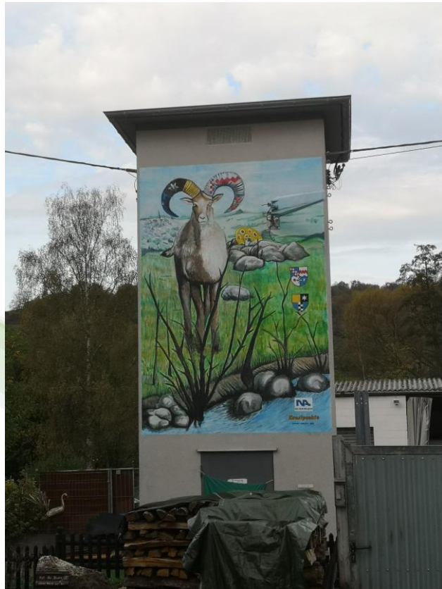
LAG Biosphärenreservat Bliesgau – Künstlerische Gestaltung & Ortsbildaufwertung Trafo-Haus Wittersheim, Gde. Mandelbachtal