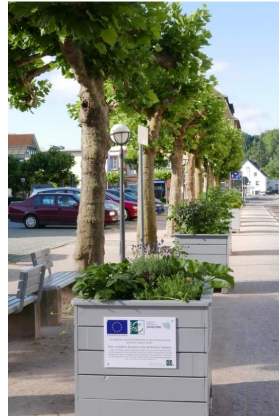
LAG Biosphärenreservat Bliesgau – Essbare Biosphärenstadt Blieskastel