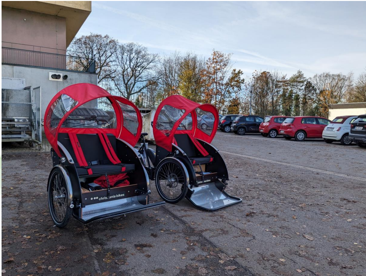
LAG SaarMitte 8 – 2 E-Rikschas für das Haus Hubwald, Eppelborn-Habach