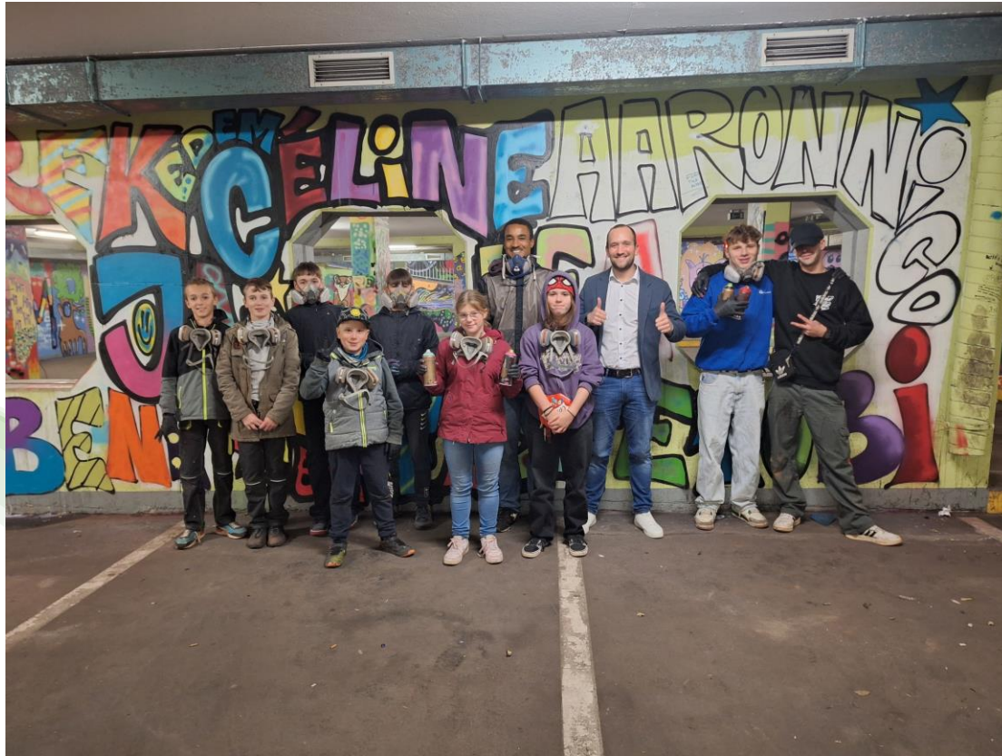
LAG SaarMitte 8 – Jugendkunst braucht Raum, Illingen