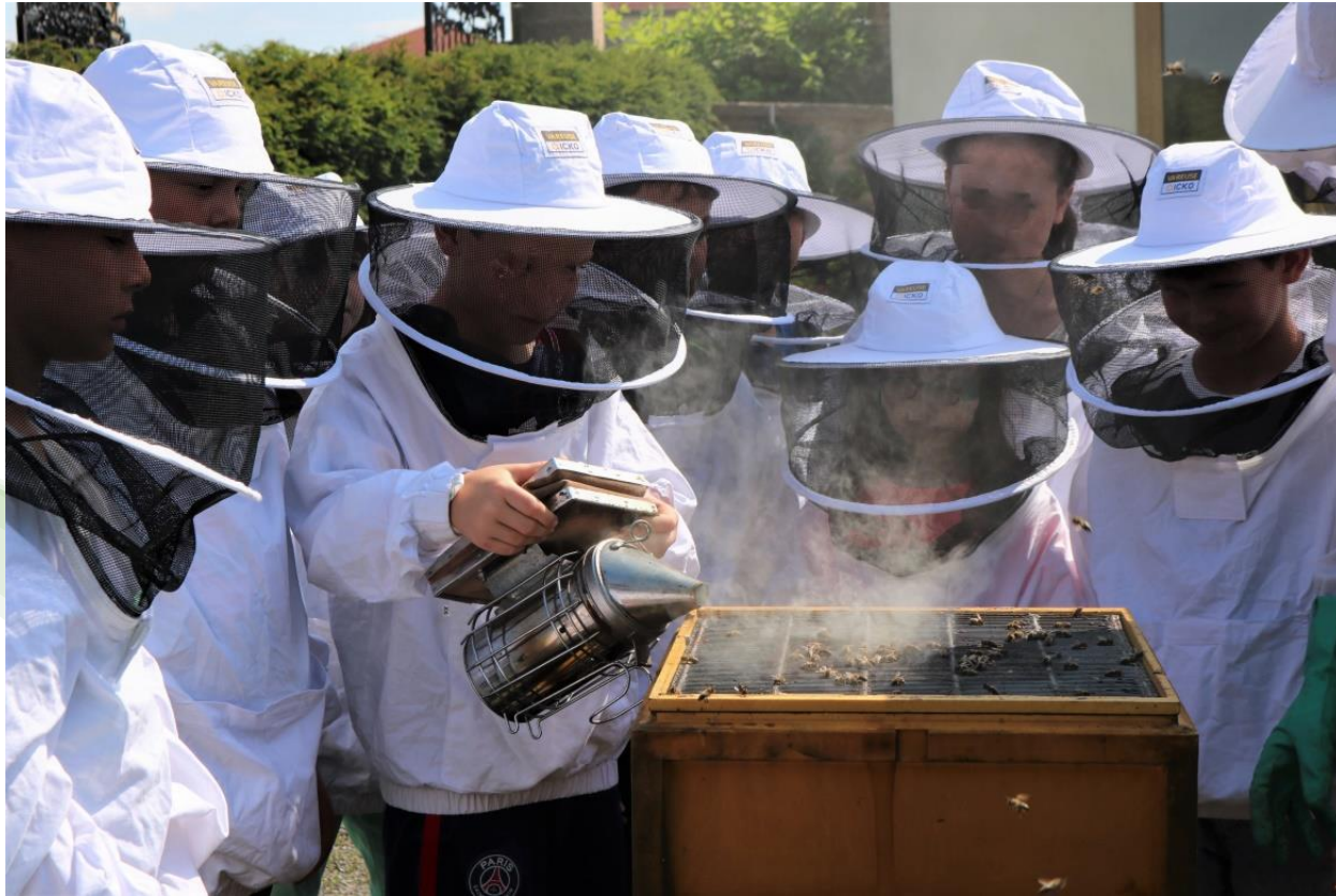
LAG KulturLandschaftsInitiative (KuLanI) St. Wendeler Land – Außerschulische Lernorte & Bildungsnetzwerk St. Wendeler Land