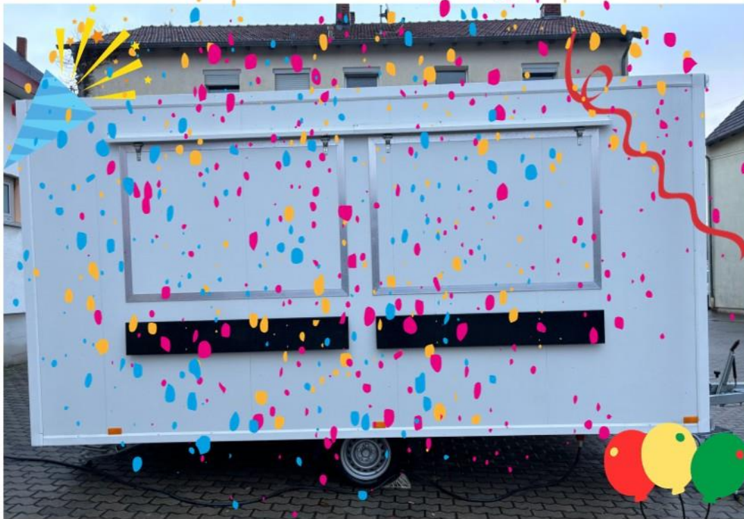
LAG SaarMitte 8 – Imbiss-Verkaufswagen für Vereine, Holz