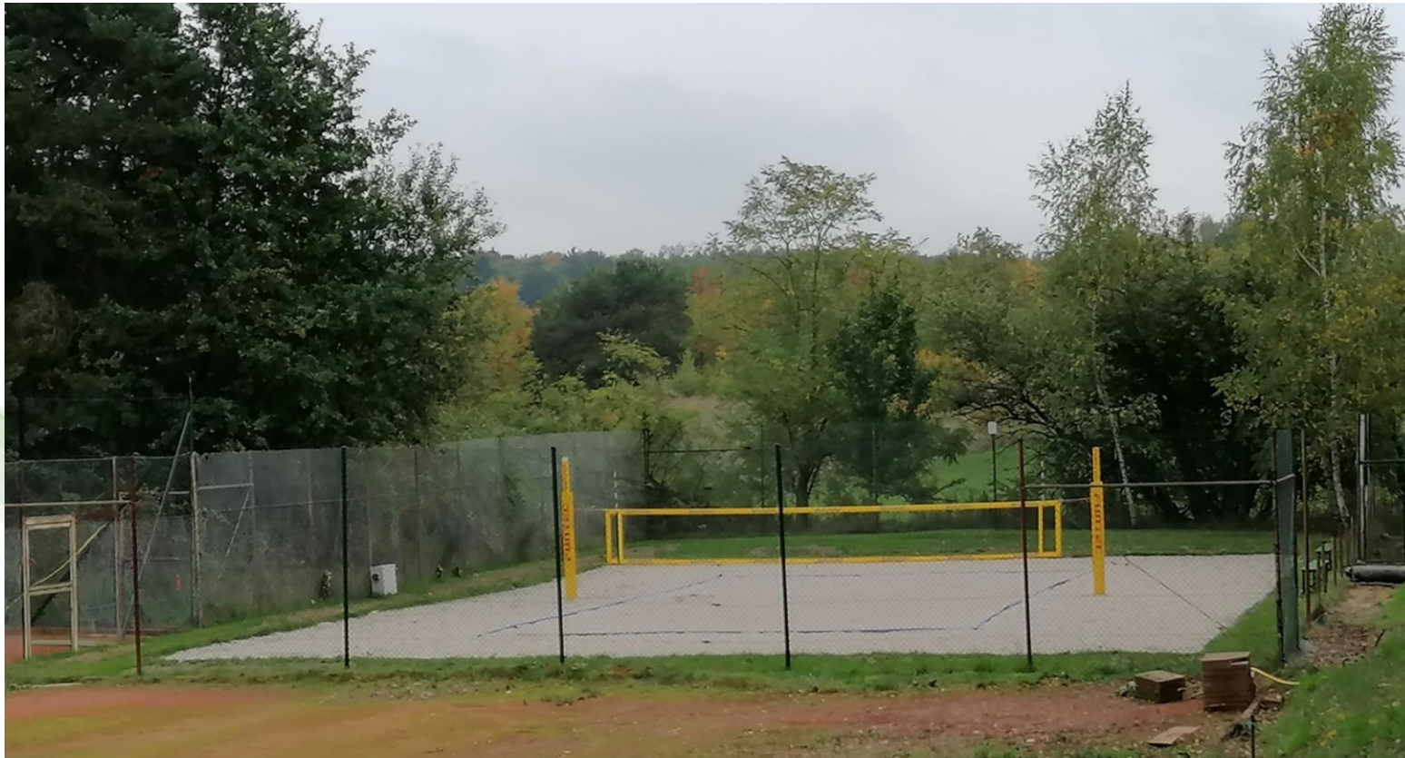
LAG Warndt-Saargau – Umnutzung Tennisplatz zum Beachvolleyballfeld in Lauterbach, Stadt Völklingen