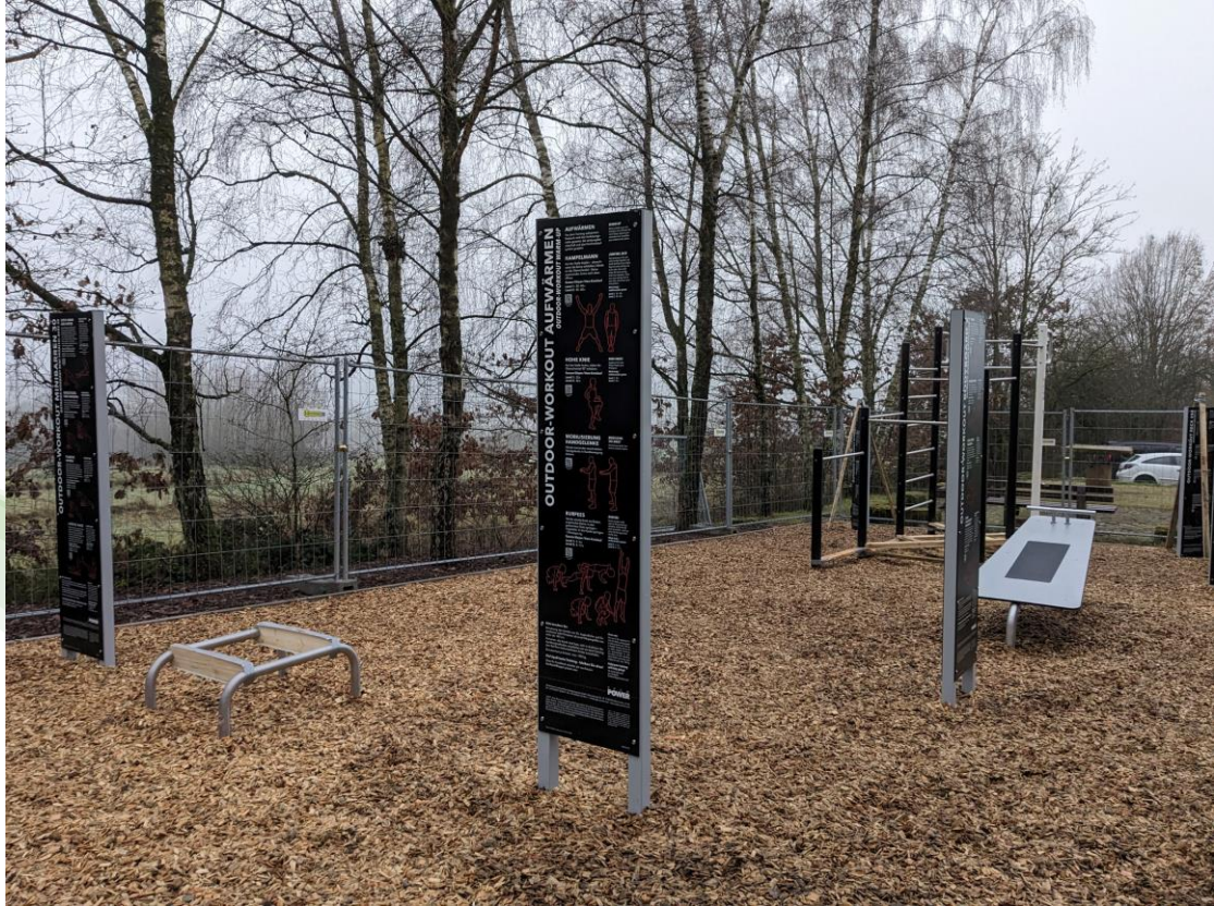
LAG SaarMitte 8 – Bewegungspark Steinrausche, Eppelborn