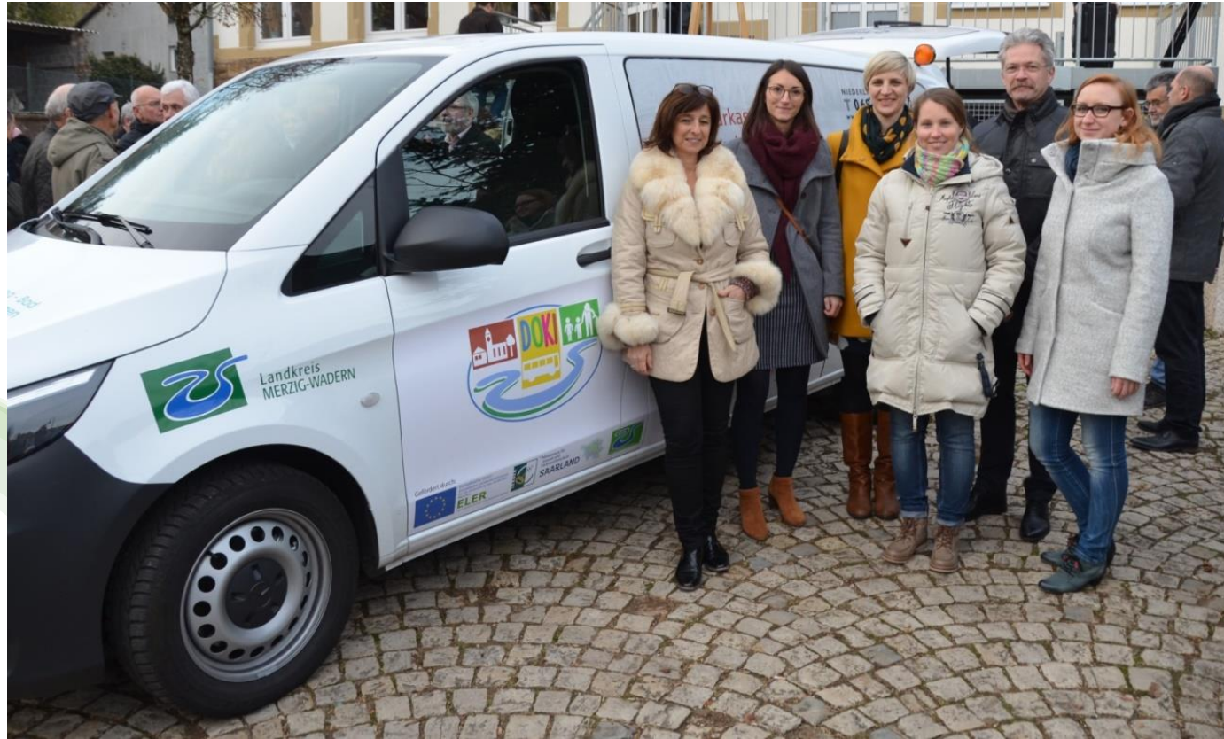
LAG Land zum Leben Merzig-Wadern – Dorf-Kindergarten-Bus (DoKi-Bus) Wehingen