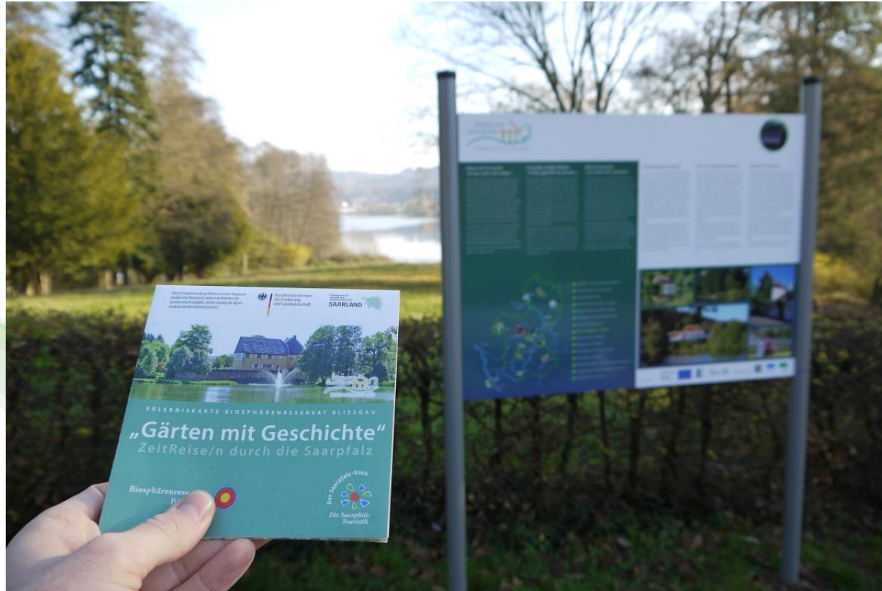
LAG Biosphärenreservat Bliesgau – Touristische Dachmarke & Einheitliche Beschilderung Gärten mit Geschichte