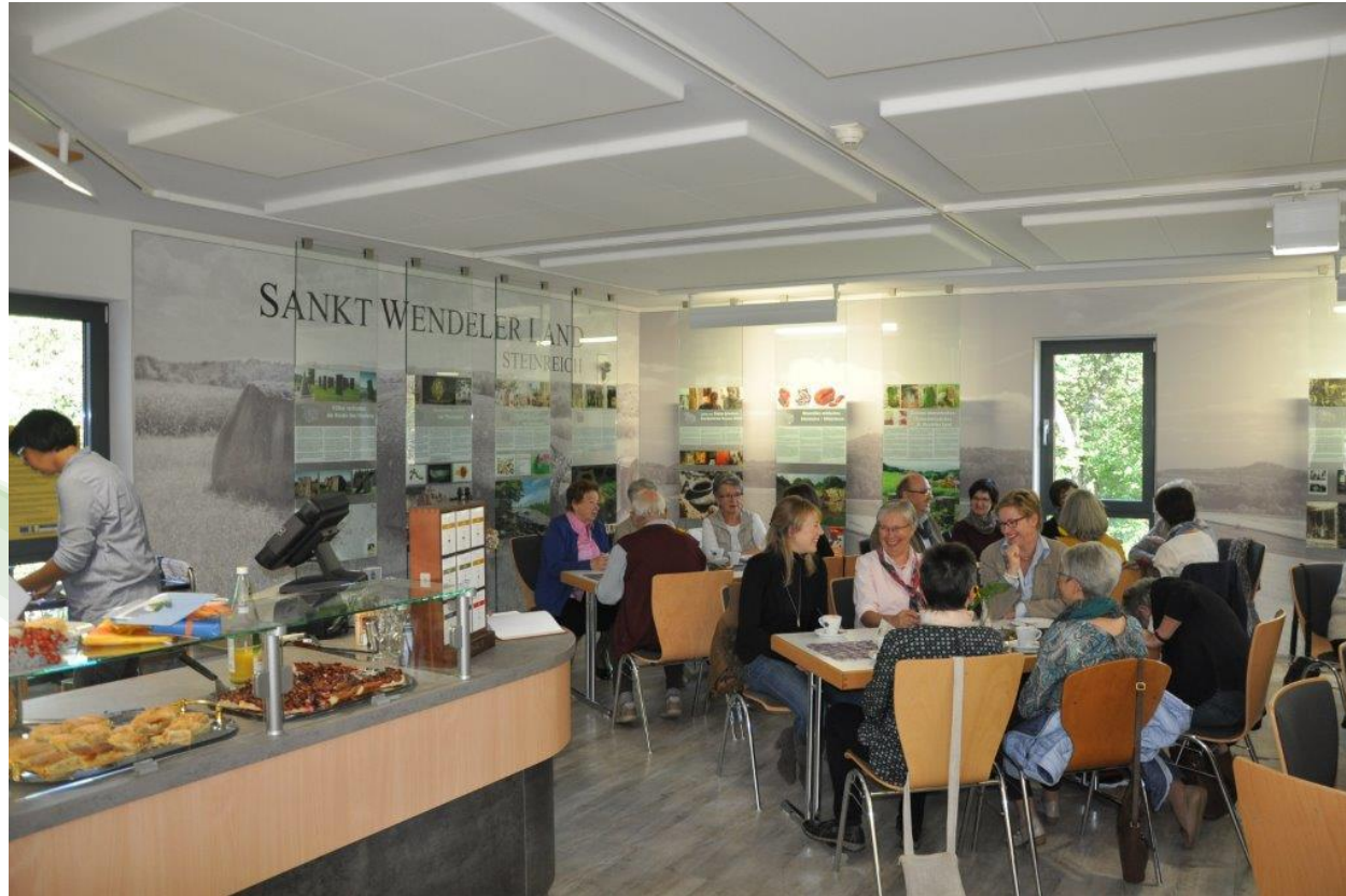
LAG KulturLandschaftsInitiative (KuLanI) St. Wendeler Land – LandKultur-Cafè Bosener Mühle & Kulturgeschichtsausstellung St. Wendeler Land 5x500