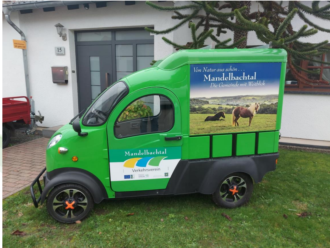
LAG Biosphärenreservat Bliesgau – Mobile Tourist-Info Gde. Mandelbachtal